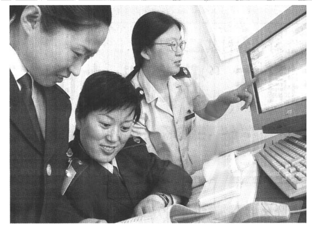
垦利县地税局全面加强征管现代化建设,推行了多元化报税和双委托报税,新开发了电子控税系统,设计制作了电子地图,使征管质效明显提高。

本报讯 近几年来,东营区黄河路街道在安置下岗失业特别是弱势群体再就业中,着力实施了培育“小老板”工程,通过“小老板”带动社区再就业,取得了显著成效。 黄河路街道确立了“以社区资源为依托,以帮扶弱势群体为重点,以培育‘小老板’为主渠道,以优质服务为保障”的工作思路,在帮扶安置弱势群体的同时,将培育、发展“小老板”作为安置工作的重中之重。街道以实际行动扶持“小老板”的发展,受到了下岗失业人员的好评。一是开展专题培训。街道对辖区内下岗失业人员进行了优惠政策专题培训,鼓励他们利用优惠政策重新就业,从事个体经营,创业发展。二是实行委托代理。街道主动协调工商、税务等有关部门,派专人帮助自谋职业者办理各种手续,对在辖区内租用或用自己房屋开办民营企业的业户,街道为其提供尽可能的减免和优惠。三是从资金上大力扶持、培育“小老板”。针对下岗失业人员缺乏开办费、启动资金等问题,街道利用小额贷款、一次性补贴等方式,多方协调帮助他们筹措资金,保证其实现再就业。 “小老板”的培育为黄河路街道的下岗失业人员的安置工作开启了一条可持续发展之路。截至目前,该街道共培育“小老板”、“小业主”114人,使辖区内下岗失业人员再就业率达到90%。 (刘英)