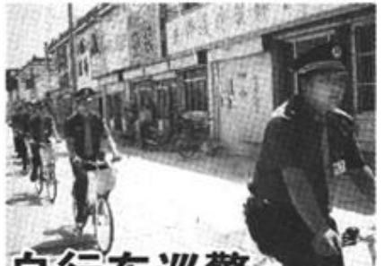
自行车巡警 街头亮丽的风景

本报讯 自进入6月份以来,一支骑自行车的巡警队活跃在胜坨镇居民小区和工业园区,成为这个镇上的一道亮丽的风景线。